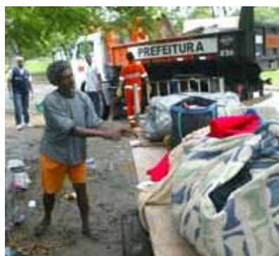
Choque de ordem no Rio de Janeiro