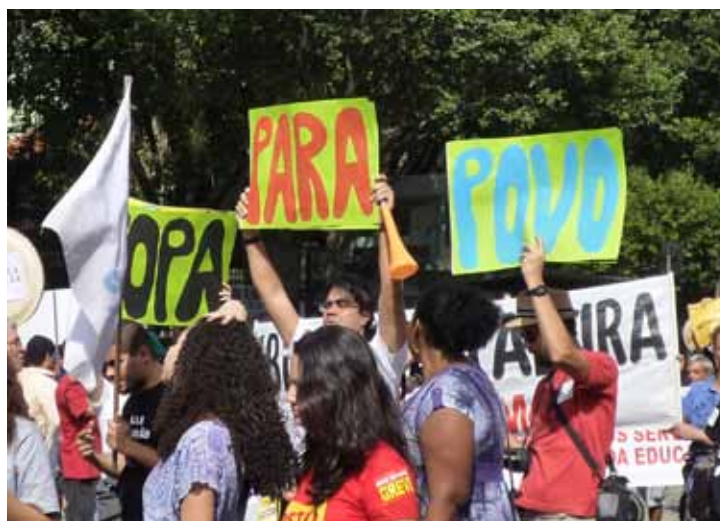
Manifestação do Comitê Popular da Copa – Rio de Janeiro

Informações sobre os processos de preparação para a Copa do Mundo de 2014 e os Jogos Olímpicos de 2016