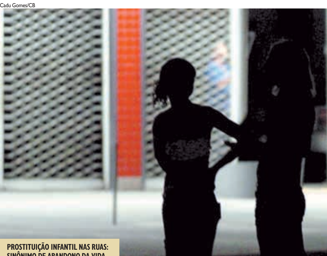
PROSTITUIÇÃO INFANTIL NAS RUAS: SINÔNIMO DE ABANDONO DA VIDA ESCOLAR DE MILHARES DE JOVENS